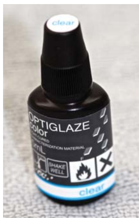
Фото 10. OPTIGLAZE CLEAR можна застосовувати для розведення барвників OPTIGLAZE Color.