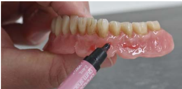
Фото 13. Моделювання більш глибоких елементів рельєфу (GM 36).