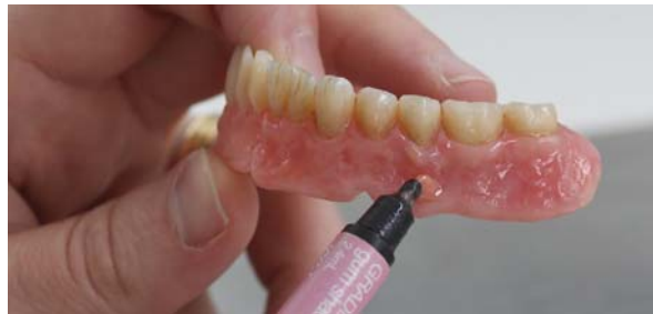
Фото 14. Моделювання в апікальній зоні (GM 31).