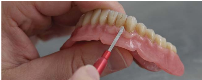
Фото 12. Моделювання пришийкових областей ясен (GM 35). Для нанесення гелів я використовую оклюзійний шпатель виробництва Ubassy. Його форма ідеально підходить для доступу до міжзубних проміжків.