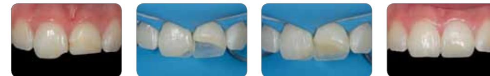
Клінічний випадок лікаря Хав'єра Тапіа Гуадікс (Іспанія) та професора Марлен Пеуманс (Бельгія)

Завдяки Essentia ви можете зробити ніби живу реставрацію передніх зубів використовуючи лише два відтинки!