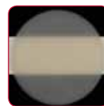
EQUIA Forte HT Fil Відтінок A2