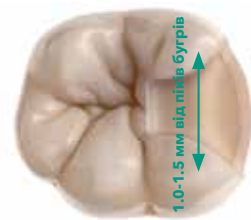
EQUIA Forte HT призначена для навантажених порожнин II Класу*.

Система, що базується на Простоті, Стабільності та Впевненості!