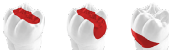
Основні показання для EQUIA Forte HT

Source: GC R&D, Japan, 2018. Дані по файлу