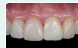
9. Фінальний результат після декількох етапів полірування