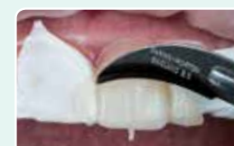
8. Видаліть надлишки композиту за допомогою скальпеля