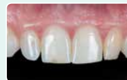
1. Початкова ситуація

Прозорість EXACLEAR дозволяє вам відслідкувати найдрібніші деталі та попередити утворення інгібованого киснем шару, таким чином полегшуючи фінішне полірування. G-aenial Universal Injectable є дуже корисним для цієї техніки завдяки своїй тиксотропності, міцності та блиску.