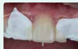
7. Полімеризуйте світлом через силіконовий ключ та видаліть його