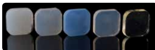
Прозорість EXACLEAR (перший праворуч) у порівнянні з конкурентами.

Це призводить до підвищення рівня полімеризації та уникнення формування інгібованого киснем шару, що полегшує фінішну обробку .