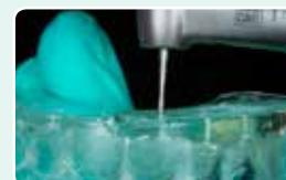
4. Просвердліть отвір у силіконовому ключі для проникнення насадки композитного шприца