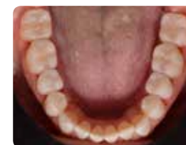
3. Ситуація після лікування з використанням техніки внесення під тиском