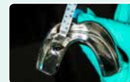
2. Заповніть відбиткову ложку EXACLEAR та зніміть відбиток з wax-up на моделі