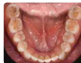
1. Початкова ситуація

Техніка внесення під тиском також ідеальна для лікування стираємості або для відтворення складної морфології. Прозорість EXACLEAR допомагає бачити та контролювати внесення під час лікування декількох зубів одночасно. Висока міцність на вигин та зносостійкість G-aenial Universal Injectable ідеальні для таких випадків на жувальній ділянці.