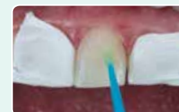
5. Ізолюйте сусідні зуби, протравіть емаль та нанесіть адгезив