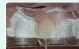
6. Установіть силіконовий ключ у порожнині рота та внесіть G-aenial Universal Injectable через отвір у ключі