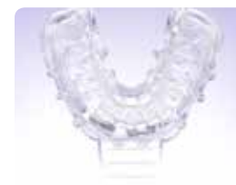
2. Заповніть відбиткову ложку EXACLEAR та зніміть відбиток з wax-up на моделі