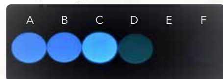
Флюоресценція 0,5 мм дисків. A: G-CEM Veneer; B: Variolink Esthetic; C: Panavia V5; D: NX3 Nexus; E: Calibri; F: RelyX Unicem