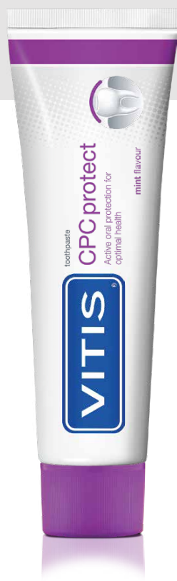
Зубна паста VITIS СПС протект