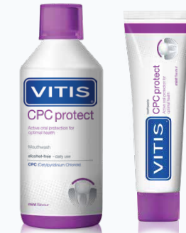
ВІТІС CPC протект

Всі пацієнти Ополіскувач зі вмістом 0.07% хлориду цетилпіридину (CPC) Зубна паста зі вмістом 0.14% хлориду цетилпіридину (CPC)