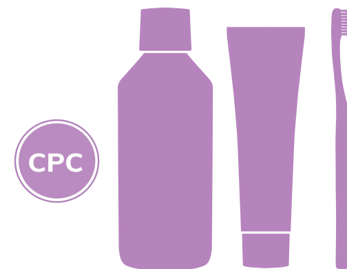
CPC – cetylpyridinium chloride хлорид цетилпіридину

Важливо посилити щоденну гігієну , використовуючи правильні засоби для активного захисту порожнини рота.