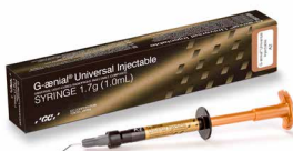
G-aenial Universal Injectable Високоміцний текучий композит