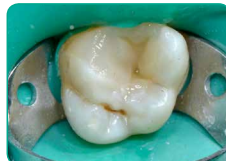
Фінішний шар G-aenial Universal Injectable (відтінок A3)