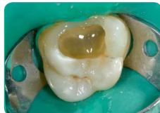
Внесення everX Flow (відтінок Bulk)