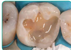
Внесення everX Flow (відтінок Dentin)