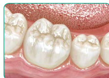
Фінальний результат після покриття традиційним композитом