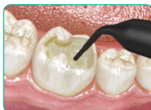
Заповнить порожнину за допомогою everX Flow