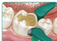
У випадку порожнини II Класу відновить відсутні стінки традиційним композитом