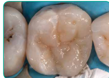
Фінішний шар Essentia (відтінок Universal)