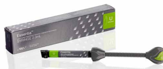
Essentia Universal Універсальний пакувальний композит

everX Flow, Essentia, G-Premio BOND та G-aenial Universal Injectable є торговими марками GC. Filtek Bulk Fill Flowable, SDR flow+ та Tetric EvoFlow Bulk Fill не є торговими марками GC.